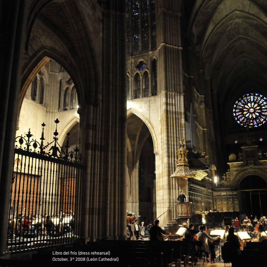
Libro del frío (dress rehearsal) October, 3 rd 2008 (León Cathedral)